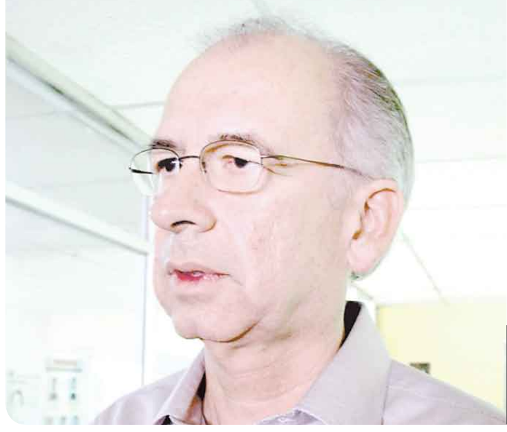
El coordinador de Asuntos Estratégicos busca poner fin al conflicto por la tenencia de la tierra en el Golfo.

Adornan la escena muchas plantitas en flor. Dicen que las flores